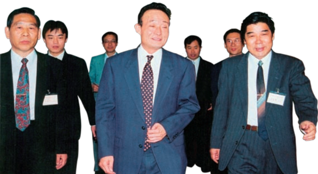
1995年5月5日，吴邦国同志出席公司成立大会

公司在大力收缩战线的同时，以已有企业为基础，通过加强经营管理的各项措施，逐步培育并形成了公司的优势企业和业务板块，规模效益逐步显现。对于不能培育成为一流的投资企业而非主业项目，则集中到资产管理公司，提升价值，寻找机会，加速变现，支持公司主业的发展。此外，作为投资控股公司，从优化资产结构，完善投资功能的需求出发，也十分重视金融领域的投资，参股了招商银行、国泰君安证券股