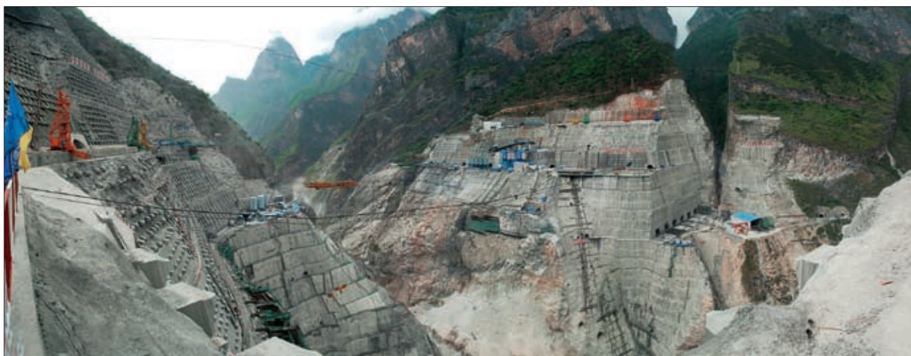
“改造河山”——305米的世界第一高双曲拱坝锦屏一级水电站大坝施工现场 宋志评