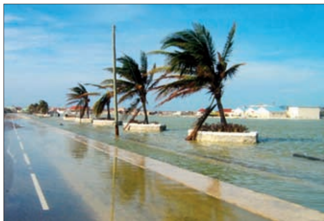
牙买加艾克飓风过后 付强