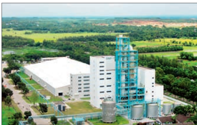
孟加拉磷酸二铵化肥厂全貌(中成集团承建) 钟古芬