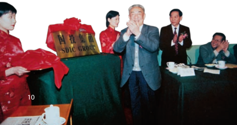
1998年2月16日，国投集团成立

（一）迈出科学发展新步伐。 公司新的领导班子上任后，党组在认真学习党的十六大精神的基础上，对公司的现状进行分析，认为加快公司发展的条件已经具备。一是经过9年的努力，公司资产已具相当规模，盈利水平逐年增加，积累了一定的资金实力，有较大的融资空间。二是经过不断的资产结构调整，公司业务日益清晰和集中，已经拥有一批可培育为一流企业的投资项目，在重点业务领域具备做大做强的基本条件。三是通过坚持不懈地推行现代企业制度，投资企业管理规范，经过内部改革，公司管理能力、投资决策能力不断增强，建立起了比较健全的监督约束机制和投资决策体系。四是培养和锻炼了一支可以信赖、能打硬仗的员工队伍。五是积极发展关系国民经济命脉的行业，以及基础性、资源性产业，公司的