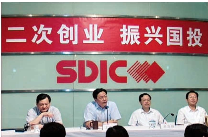
2003年6月3日，公司召开二次创业动员大会